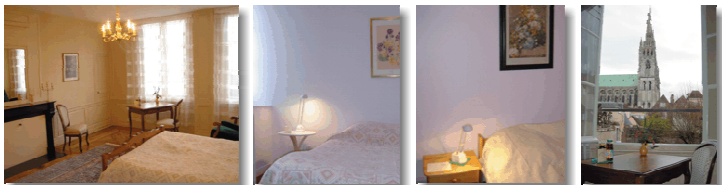
Centre Œcuménique & Artistique (13 Rue du Docteur de Fourmestraux).

La Ville de Chartres est située à 1h de Paris, facilement atteignable par le train. Sa cathédrale, inscrite au patrimoine mondial de l'UNESCO est d'une qualité artistique exceptionnelle.